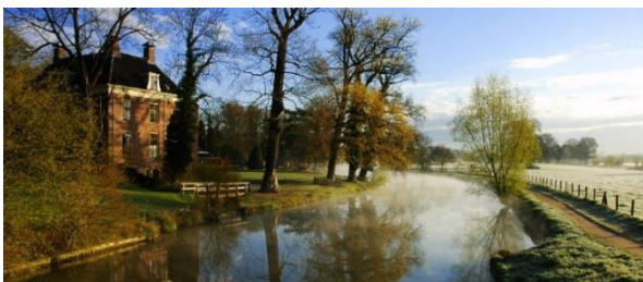
Kromme Rijn bij Rhijnauwe

Strategische mooie gebieden passerend, zoals de Gooyerwetering; Langbroekerwetering; Schalkwijkse wetering en via Fort Honswijk vervolgen we de Lek via de Lekdijk naar Wijk bij Duurstede.