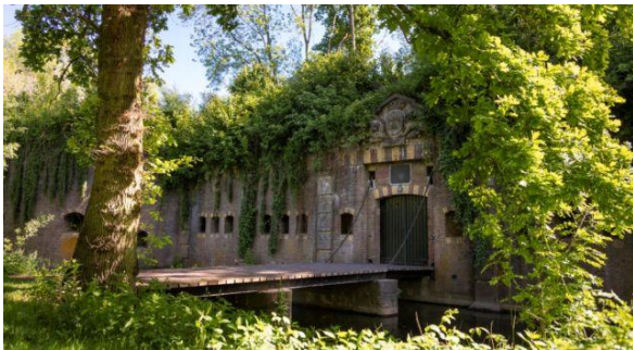
Fort bij Vechten

Ten zuidoosten van de lijn Utrecht - Amersfoort ligt een natuurlijke verdedigingsbarrière in de vorm van de Utrechtse Heuvelrug en op de grens met Gelderland de Grebbeberg.